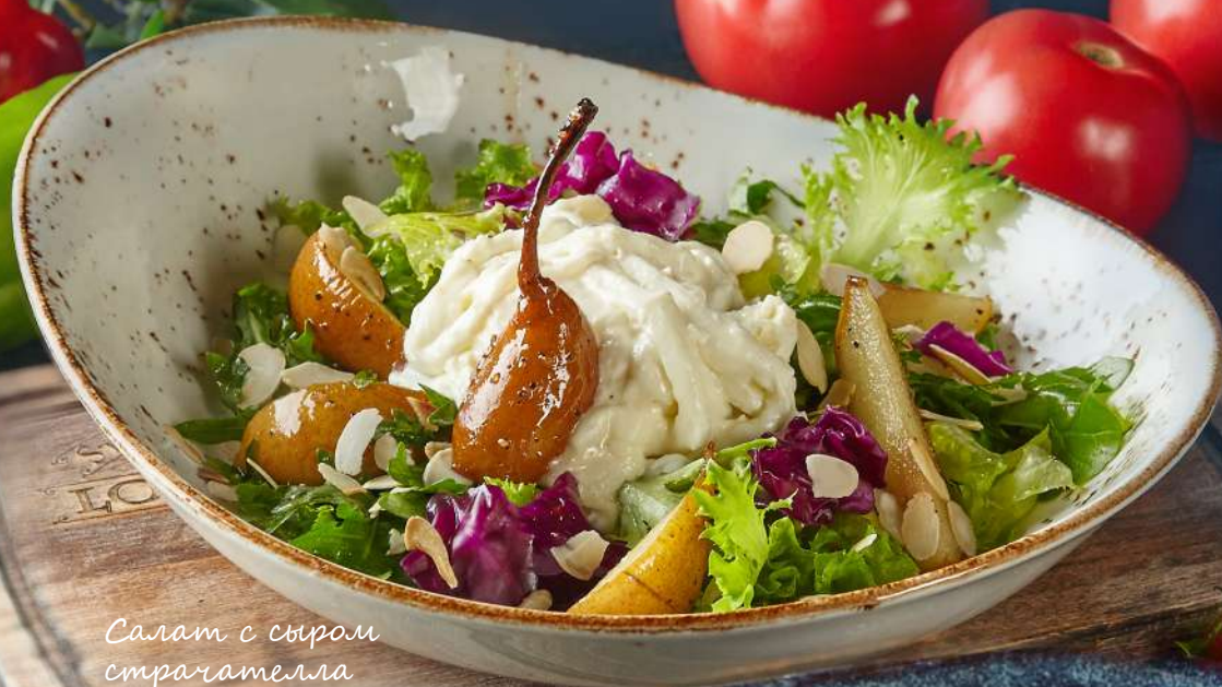
Салат с сыром страчателла