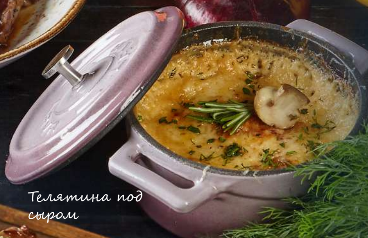
Телятина под сыром