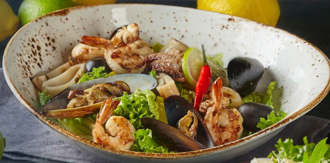
Салат с морепродуктами

ЦЕЗАРЬ ..... 250 г с куриной грудкой гриль ..... 425 р с куриной грудкой в хрустящей панировке..... 425 р с семгой..... 575 р с тигровыми креветками ..... 725 р