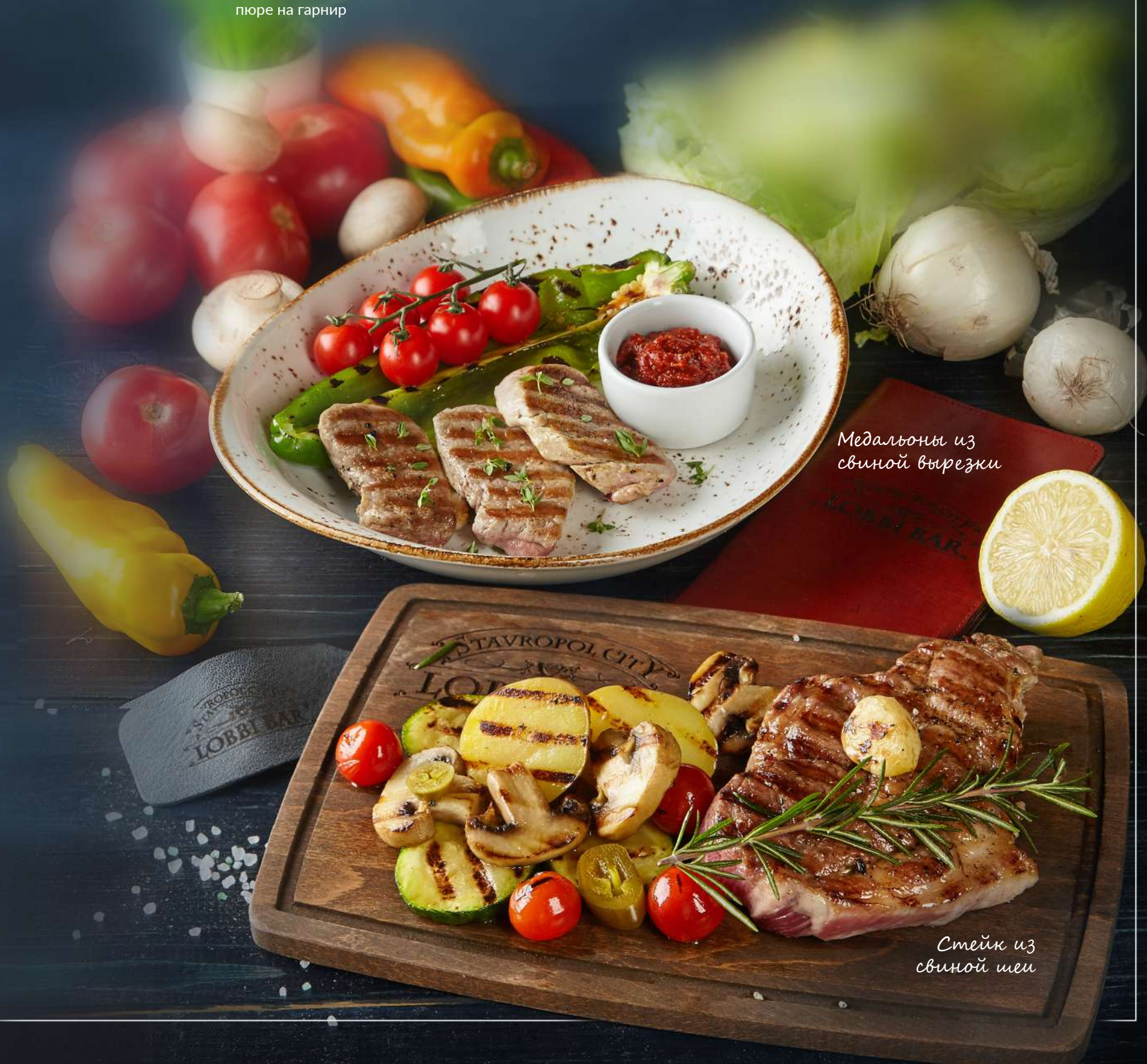
Медальоны из свиной вырезки