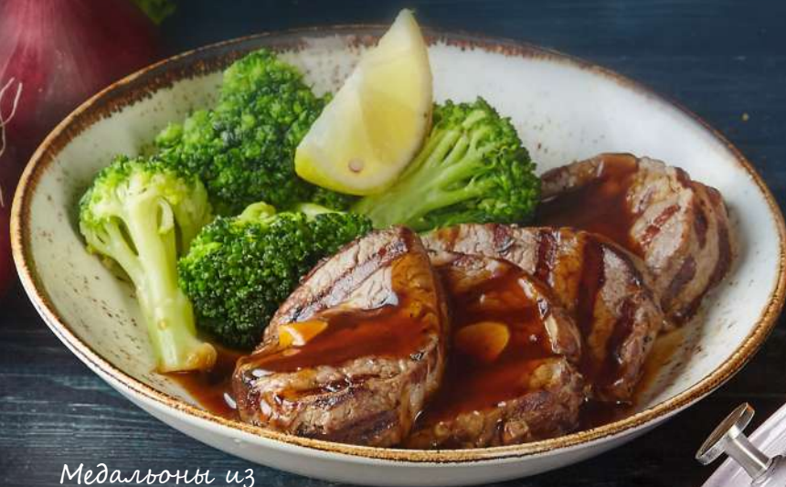
Медальоны из телятины