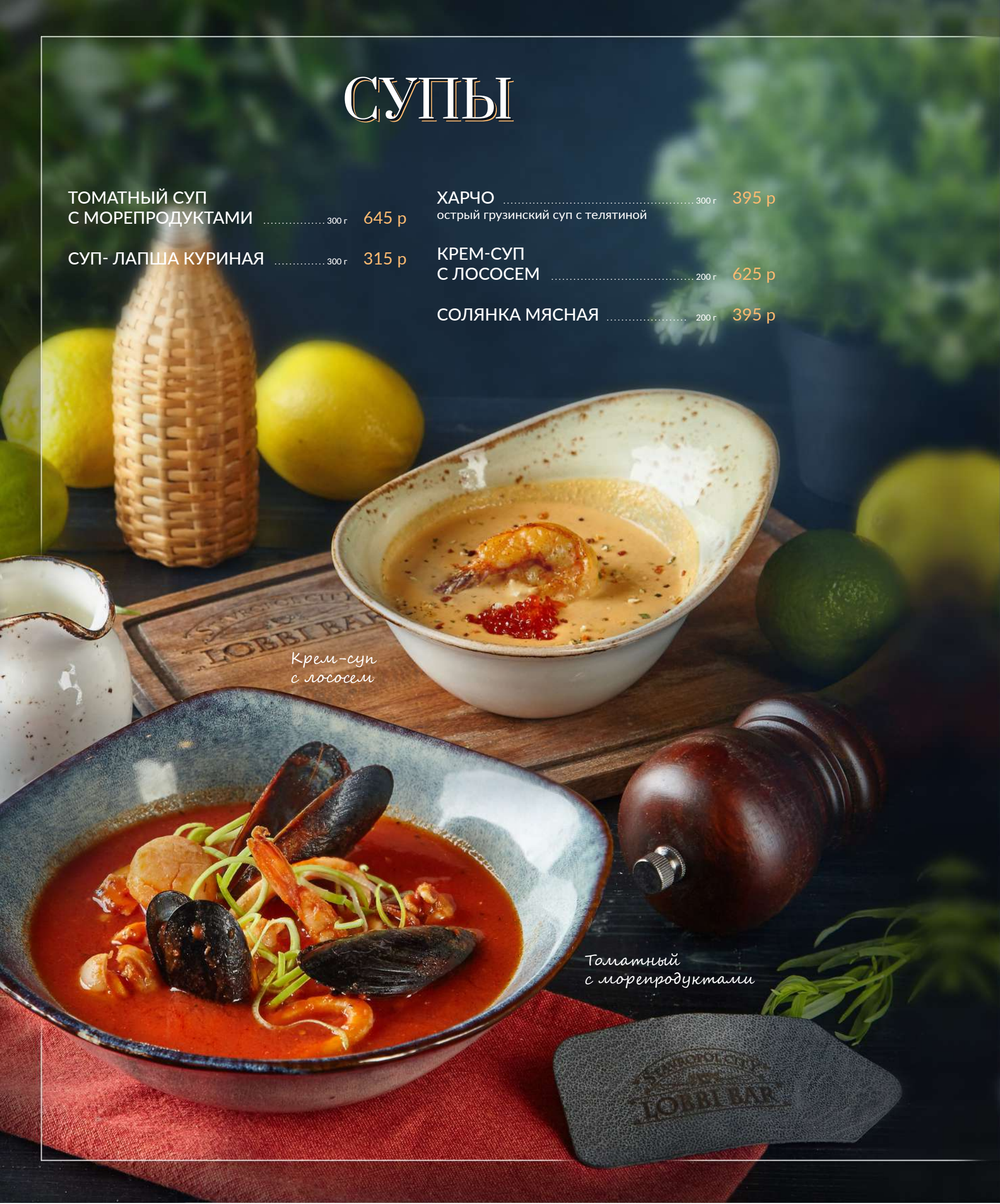
Томатный с морепродуктами