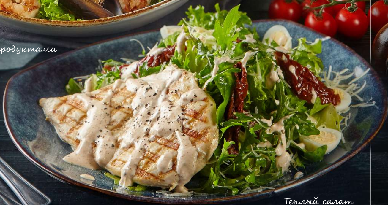
Теплый салат с филе индейки